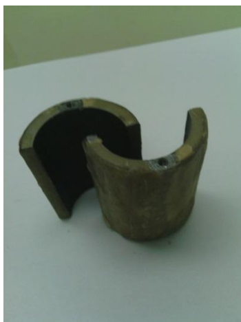
Slika 3. Poluprstenovi cijevi zaštićeni voskom

Poluprstenovi sa formiranom navrtkom su sušeni 60 minuta u eksikatoru sa žarenim kalcijum hloridom, a zatim mjereni na analitičkoj vagi Mettler AE163 Dual range balance 0-30g (readability 0,01mg), 0-160g (readability 0,1mg). Spoljašna strana poluprstenova, navrtke i vijci sve do izolacije bakarnog provodnika, je zaštićena voskom (slika 3).