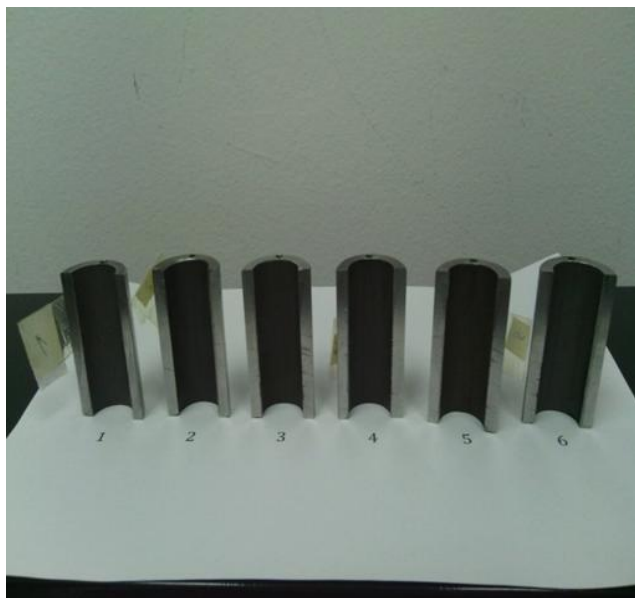
Slika 2. Uzorci cijevi, poluprstenovi, sa pripremljenim navrtkama

Poluprstenovi sa formiranom navrtkom su sušeni 60 minuta u eksikatoru sa žarenim kalcijum hloridom, a zatim mjereni na analitičkoj vagi Mettler AE163 Dual range balance 0-30g (readability 0,01mg), 0-160g (readability 0,1mg). Spoljašna strana poluprstenova, navrtke i vijci sve do izolacije bakarnog provodnika, je zaštićena voskom (slika 3).