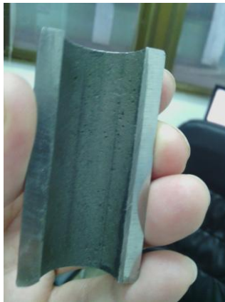
Slika 4. Tačkasta korozija na unutrašnjoj površini cijevi

Vizuelno je zapaženo da zaprljanost cijevi nije ravnomjerna, a nakon bajcovanja je vidljiva tačkasta korozija, slika 4.